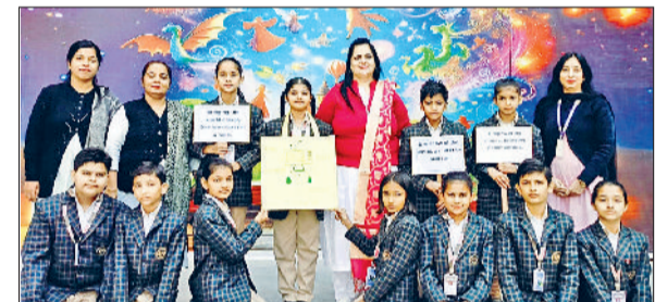
फतेहाबाद। क्रेसंट स्कूल में विश्व टेलीविजन दिवस पर आयोजित कार्यक्रम विद्यार्थियों को प्रोत्साहित करते प्रधानाचार्या।