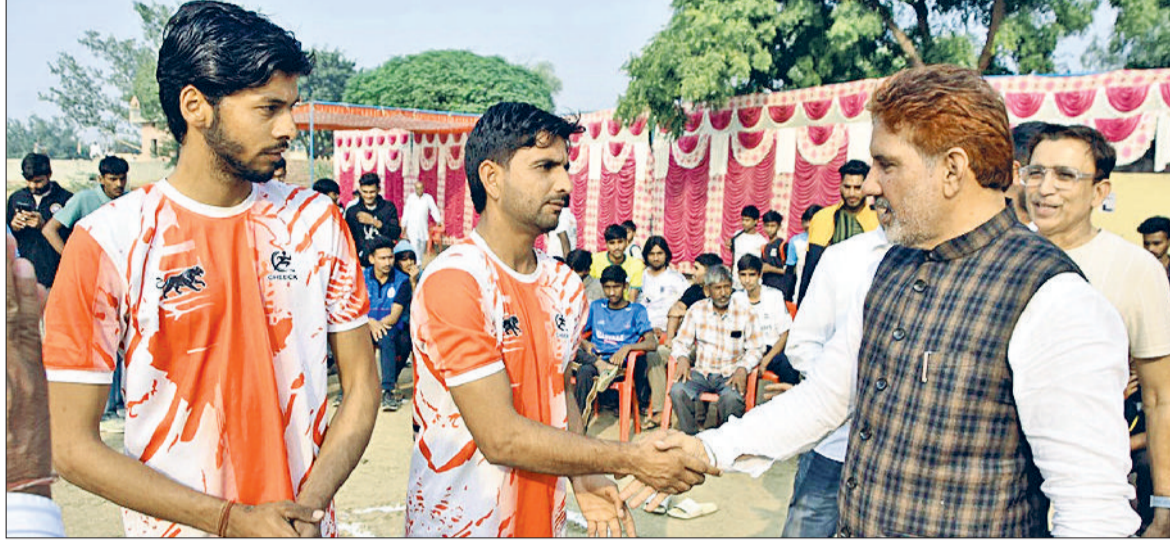
फतेहाबाद। खिलाडियों से मिलकर प्रोत्साहित करते सांसद सुभाष बराला।

सांसद ने उपस्थित नागरिकों और खिलाडियों से आह्वान किया कि वे समाज में जागरूकता फैलाएं और युवाओं को नशे, जुए और अन्य दुव्यसनों से दूर रखने के लिए काम करें।