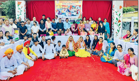
फतेहाबाद। पीएम श्री जेएनवी, खारा खेड़ी में आयोजित आदर्श ग्राम सभा में प्रतिभागिता करते विद्यार्थी।