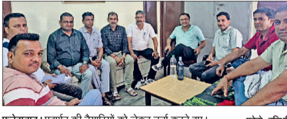
फतेहाबाद। प्रदर्शन की तैयारियों को लेकर चर्चा करते हुए।