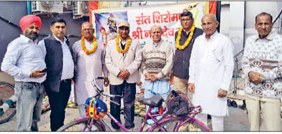
फतेहाबाद। साइकिल व रथयात्रा का स्वागत करते नामदेव दर्जी समाज के लोग।