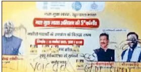
फतेहाबाद। बीजेपी पोस्टर पर लिखा वोट चोर गद्दी छोड़ का नारा।

पोस्टर पर वोट चोर-गद्दी छोड़ का नारा लिखा