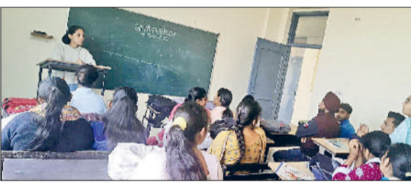
फतेहाबाद। टीचिंग-लर्निंग मैटेरियल वर्कशॉप में भाग लेते विद्यार्थी।